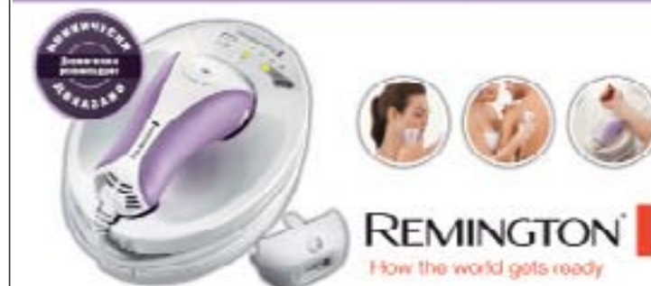
Фото: Legion-Media (2)

21% мужчин считают нормальным, если женщина симулирует оргазм